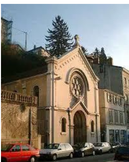
Temple de Vienne

Nous n'avons aucune trace du premier temple. Il y avait pourtant des pasteurs de 1561 à 1566.