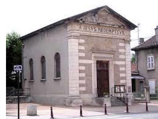
Temple de Bourgoin

Le temple actuel a été dédié le 21 août 1853.