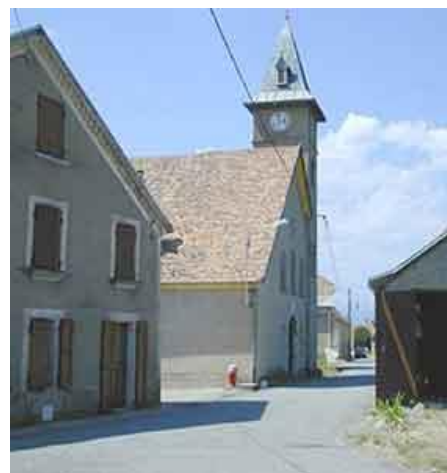
Temple de Tréminis

La municipalité en reconstruit un autre plus beau et plus vaste. Il se trouve à Château-Bas sur le bord de la route qui traverse le village.