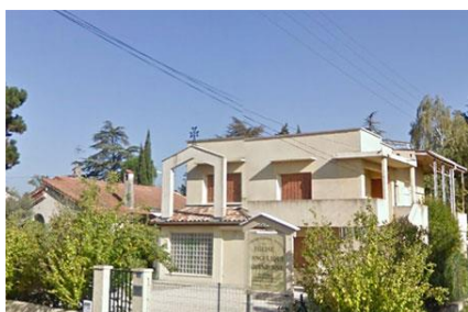
Temple arménien de Montélimar

Un pasteur de Pont d'Aubenas, Arakel Papazian, commence des réunions dans les années 1930. Les cultes se déroulent au temple protestant les dimanches après-midi et sont assurés fidèlement par les pasteurs pendant près de 40 ans.