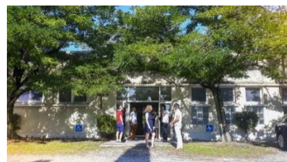
Chapelle Méthodiste de Montélimar

Depuis sa création en 1969, l'Église Évangélique Méthodiste de Montélimar ne cesse de grandir. Précédemment domiciliée rue de Sarda, derrière la gare de Montélimar, l'église déménage à la rue Louis Aragon avec des locaux plus appropriés.