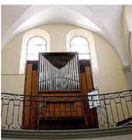
Orgue du temple

À 1789, la liberté de culte est rétablie. Les Révolutionnaires interdisent ensuite les couvents et monastères : le couvent des Ursulines devient bien national. Dans le cadre du régime concordataire français, la chapelle des Ursulines est confiée aux protestants de Montélimar le 19 juillet 1802. En 1971 est inauguré un nouvel orgue.