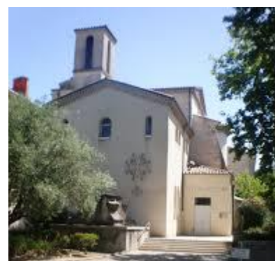
Temple actuel de Montélimar

À 1789, la liberté de culte est rétablie. Les Révolutionnaires interdisent ensuite les couvents et monastères : le couvent des Ursulines devient bien national. Dans le cadre du régime concordataire français, la chapelle des Ursulines est confiée aux protestants de Montélimar le 19 juillet 1802. En 1971 est inauguré un nouvel orgue.