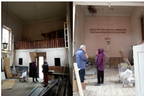
Intérieur du temple de Venterol

Le premier temple est construit vers 1598 à proximité du château Ratier. Il sera détruit en 1685. En 1845, les autorités acceptent la construction d'un temple afin de permettre aux 150 calvinistes de la commune de pratiquer dignement leur foi. Après moult péripéties, les travaux s'achèvent en septembre 1858. Le bâtiment est de style classique, sobre, dépouillé. Son isolement sur le roc marque une distance avec le reste du village.