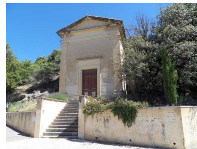
Temple de Venterol

Aujourd'hui il n'est plus consacré au culte. Il est désaffecté en 2008. En 2013-2014, d'importants travaux sont entrepris à l'initiative de l'APAVEN afin de restaurer le bâtiment et celui-ci devient une salle culturelle.