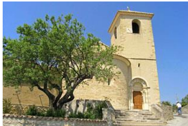
Temple de Vinsobres

L'ensemble du bâtiment extérieur était recouvert d'un enduit uniforme du XIX e siècle imitant un grand appareil régulier. Très abîmé, cet enduit a été soigneusement enlevé au cours des travaux en 1993 et 1994. Le décapage des murs durant la première phase en 1993 a fait réapparaître à l'ouest l'abside romane. Fondée sur quelques assises de pierres mal équarries, elle est construite en bel appareil moyen de pierre de taille. Une fenêtre axiale en plein centre à double ébrasement a pu être rouverte. Son décor sculpté de pétales, au sommet et à la base, est rare dans la région. Sur la face nord du clocher, une belle fenêtre ogivale a été découverte pendant les travaux de 1993. Elle avait été aussi obturée au XVII e siècle lors de la reconstruction des parties hautes du clocher.