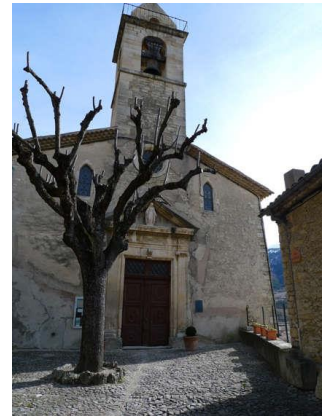
Temple/église de Montbrun

Rendue au culte catholique, elle est ruinée au cours des guerres de Religion et restaurée au cours du 17 e siècle.