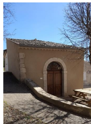
Temple de Léoux

Le temple, construit en 1789, était vaste puisqu'il pouvait recevoir cent-cinquante fidèles assis ; amputé en 1959 d'une partie menaçant ruine, il crouissait en face de l'ancienne école. La petite partie existante a été rénovée récemment.