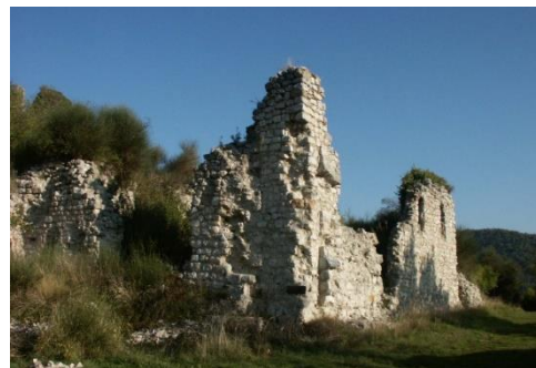
Ruine du vieux village de Condorcet

Un temple est édifié. Aujourd'hui, suite à la destruction lors de la Révocation, il n'en reste que des ruines. En 1831, il y avait 600 personnes intramuros. Faute d'eau, le village est abandonné et démoli dès 1875. Les pierres sont utilisées pour construire le nouveau village au pied de la colline. La dernière habitante du vieux bourg quitte les lieux en 1916.