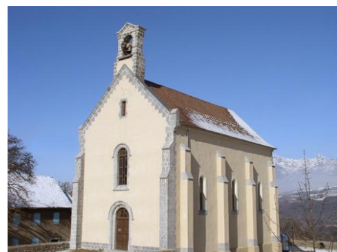
Temple de St Laurent du Cros

Les habitants de la paroisse, partisans de l'église réformée, longtemps contraints à se réunir dans des maisons prêtées par certains d'entre eux, se rassemblent alors dans une maison de prières financée avec les deniers des plus aisés.