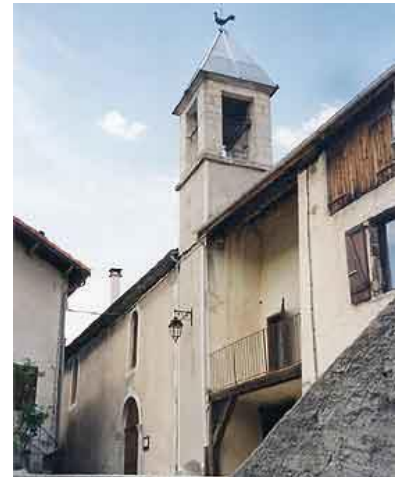
Temple de Valdrôme

Le village est connu pour avoir été, au xx e siècle, une vraie pépinière d'enseignants : la religion protestante, basée sur la lecture de la Bible, constitue un moteur puissant contre l'illettrisme. Valdrôme est l'un des rares villages à ne pas posséder d'église catholique.