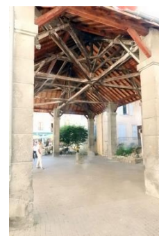
Ancien marché aux grains