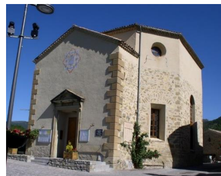
Temple devenu Mairie de Rosans

Il est utilisé pour le culte jusqu'aux environs de la guerre de 1939. Il sert quelques années à un syndicat agricole pour y stocker des produits variés, maintenant il est devenu la Mairie de la commune.