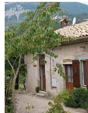
Temple de Charens

Le temple est construit en 1837. Coupé en deux, une partie est transformée en gîte communal.