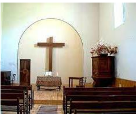
Intérieur du temple

Lors de la révocation de l'édit de Nantes, 42 familles émigrent et les Valdrômois connaissent les vexations, les dragonnades et les galères. Le temple est reconstruit en 1818.