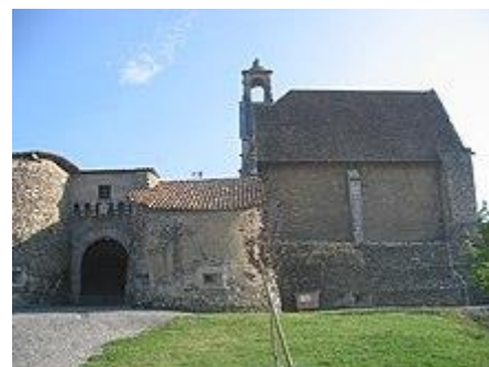
Château de Tallard