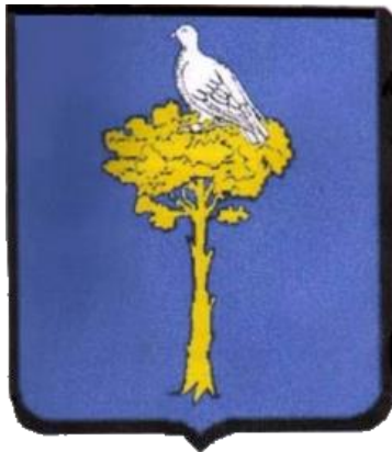
Armoirie des RAMBAUD

Le 20 avril 1562 Jacques RAMBAUD est déchu de ses fonctions de prévôt pour incapacité, car hérétique. Cet acte de rigueur du chapitre de Gap à l'égard de Jacques RAMBAUD est probablement la cause immédiate de la prise d'armes imminente des protestants du Gapençais et de la première guerre de religion à Gap.