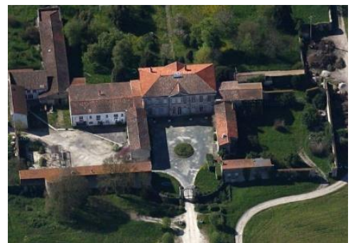
Château de Cramahé