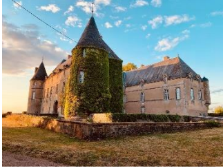
Château de Coulon

Salomon BLOSSET de Loche naît dans le hameau de Val d'Isère 1 , dépendant de Tignes, dans le Dauphiné.