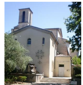
Temple de Montélimar

En 1940, âgé de 59 ans, Charles doit quitter son ministère pour raisons de santé.