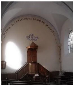
Intérieur Temple de Tréscleoux