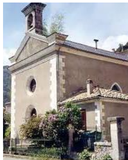
Temple de Trescléoux