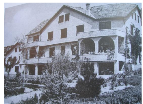
École de Beauvallon