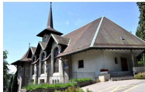
Temple de Chailly

Abondamment nourri par l'étude du livre de Job, des Évangiles et de méditations sur le sens de la Croix de Jésus, il s'est également préoccupé de la souffrance d'autrui et comment l'aborder.