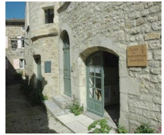
Entrée du Musée