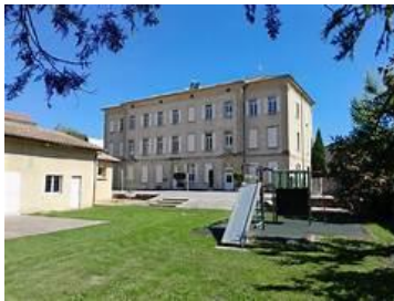
Maison d'Accueil de Crest

2022 : Fermeture du dispositif Grands Mineurs et sortie des Internats du dispositif Hébergements Diversifiés qui est rattaché à la Maison d'Accueil LOUMA